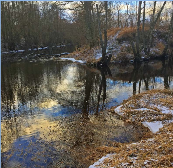
Almaån och Hörlingeån möts här.