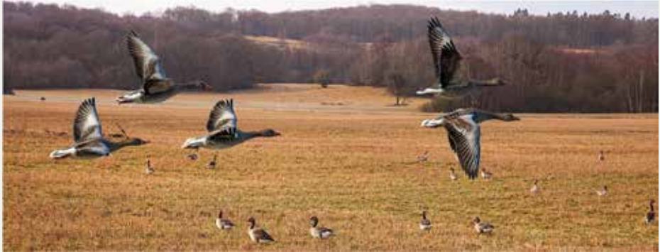
Grågäss vid Hovdalaälven 2017-03-12 (bilden är ett montage)

Väder: Kall natt (- 5 gr C) med dimma på morgonen, därefter växlande molnighet och vindstilla. En mycket vacker förmiddag med tydliga förändringar om vår. I år är Finjasjön endast några decimeter över normalvattenstånd.