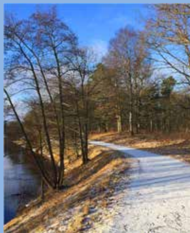
Almaån vid gamla T4:s övningsområde.

Övriga observationer: Kungsfiskare, 1 ex vid Almaån och vildsvin, en sugga med fem kulningar på fälten vid Almaån, öster om rv 117.