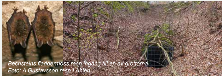
Bechsteins fladdermöss resp ingång till en av grotterna

6 ex av Bechsteins fladdermus (5 av dessa satt i en tät grupp i taket), 1 ex av långörad fladdermus (brunlångöra), 7 ex av mustasch/Brandts fladdermus och 5 ex av vattenfladdermus, alltså sammanlagt 19 individer påträffades.