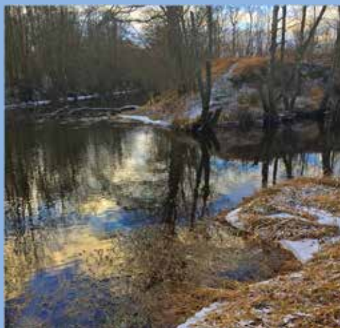
Almaån och Hörlingeån möts här.

Grågäss på fält vid ån! Antalssiffran är ungefärlig!