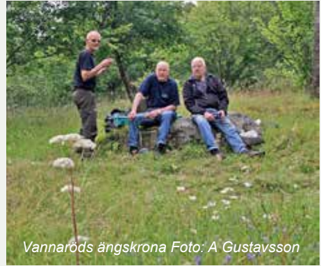
Vannaröds ängskrona

Mellan 9 och 12 ägnade sig fyra liemän, Kurt Sköld, Sune Sandén, Kjell Persson och ego, åt slätter i Vannaröds Ängskrona.