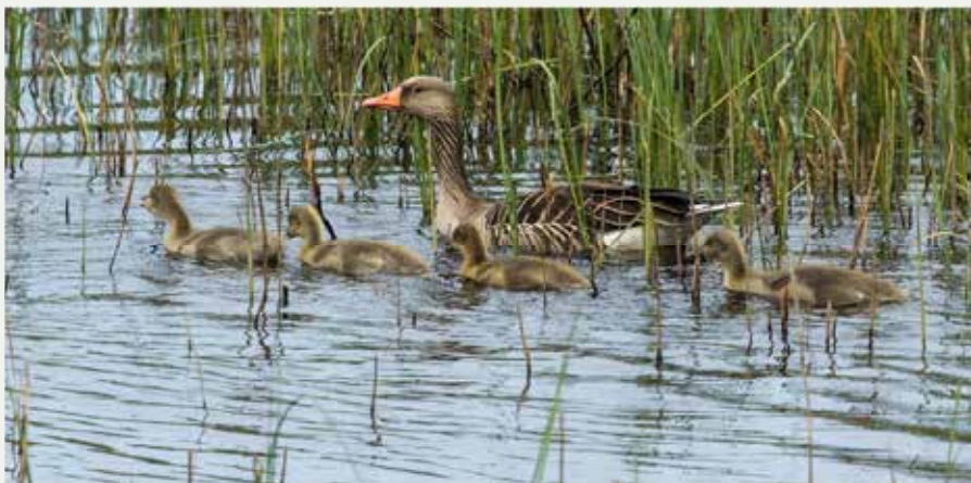
Bild: Grågäsen är numera en mycket vanlig häckfågel i Finjasjön - har nu kläckt fram sina kullar.

Inventerare: B Severson T&T Persson A Gustavsson L Björkqvist A Thomasson T Johnsson 2016: 762 (8 personer) T Johnsson G Malm (inv den 8/5) 2015: 595 2014: 656