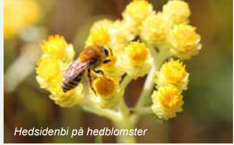
Hedsidenbi på hedblomster