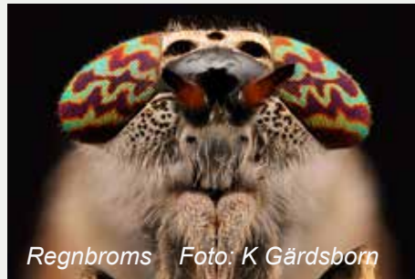
Regnbroms