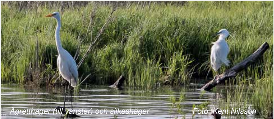
Agretthäger (till vänster) och silkeshäger