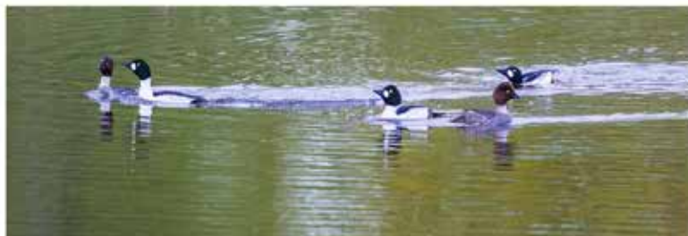
Ett flertal spelande knipor i dammarna vid reningsverket 2019-05-05

Kommentarer: Skrattmåsar häckar på Lillön och vid Magle och Stoby våtmarker (sannolikt fler individer än de här angivna!). Extremt kalla nätter har påverkat naturen menligt f n.