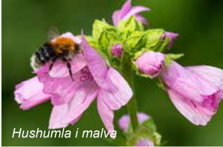
Hushumla i malva

Onsdagen den 18 september kl 18:30. Vägkanternas fauna och flora med Pål Axel Olsson